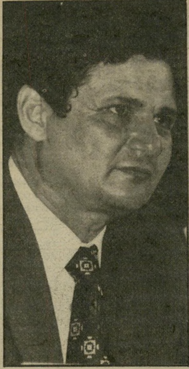
שר-אוצר ארידור לקנות ולמכור "ישפרו"