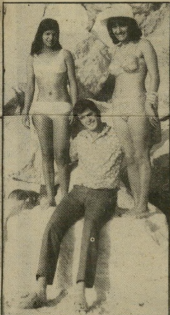
קורא פרסקי בגן-העדן

שכן שני - מברך את אשתו כתגרוז בשוק, שכן שלישי - משמיע קללות כמו במיגרש-כדורגל, שכן רביעי - משליך אשפה מהפנטהאון, שכן חמישי - מצטפף בריכבו בשבתות ובחגים, שכן שישי - מגנן על מיתריי לייכנו בפסנתר, שכן שביעי - מפססם כלבים ו- התולים,