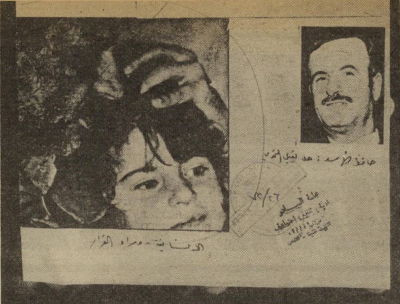
ערסאת והיורה: תמונה אמורה החלטות לא מובנות

7 חומר המיועד לפירסום מובא לאיר שור הצנזורה. הסיפורים על מה שהוא פוסל ומה הוא מאשר מעוררים גיחוך. חומו, מאלביאדר, שולח 400 עמודים לצנזור כדי שישאיר לו לבסוף 75. הם מצנזרים הכל, זה תלוי בעיקר במצב הרוח של מי שעובד שם. לא אחת מצנזרים חומר סיפורי שטורי וקאריקאט שורות. תמונת הילד הפצוע, שצולם בביי רות ושאתה קיבל בזמן המלחמה רונאלד רגן נפסלה אצלנו לפירסום. תמונות שר הופיעו בעיתונות הישראלית לא התירו לפירסום אצלנו. כשעפאית עוב את ביירות התקבל באותה, פורסמה תמונה של הפגישה שלו עם ראש הממשלה שם ב-