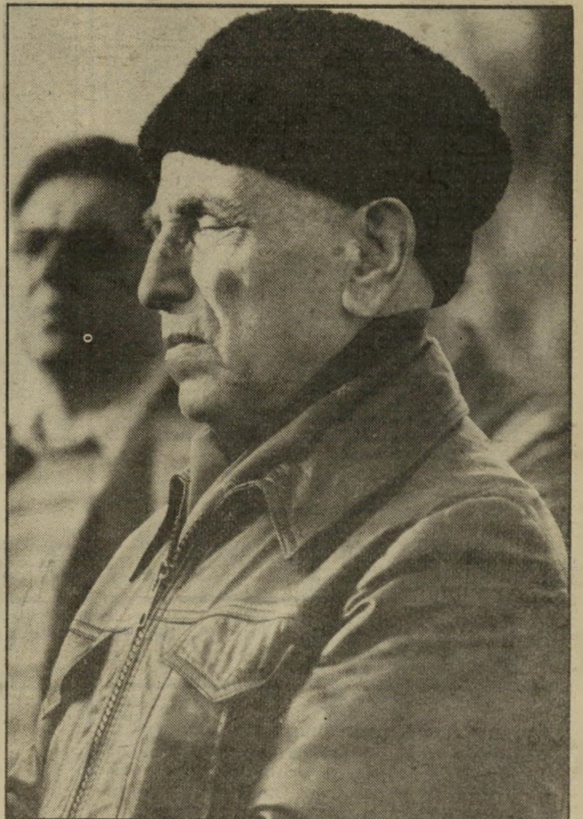
הבוש בכובעי פרווה גדול בא לאזכרה ליום השלושים למותו של רביאלוף חיים לסקוב. הראל, הממונה על שירותי הביטחון וראש המוסד לשעבר, עמד בצד. מדי פעם ניגשו אליו מכרים ותקים ושוחחו איתו.