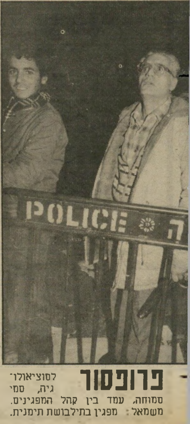
פרופסור לסוציאולוגי גיה, סמי סוחוה, עמד בין קהל המפגינים. משמאל: מפגין בתילבושת תימנית.