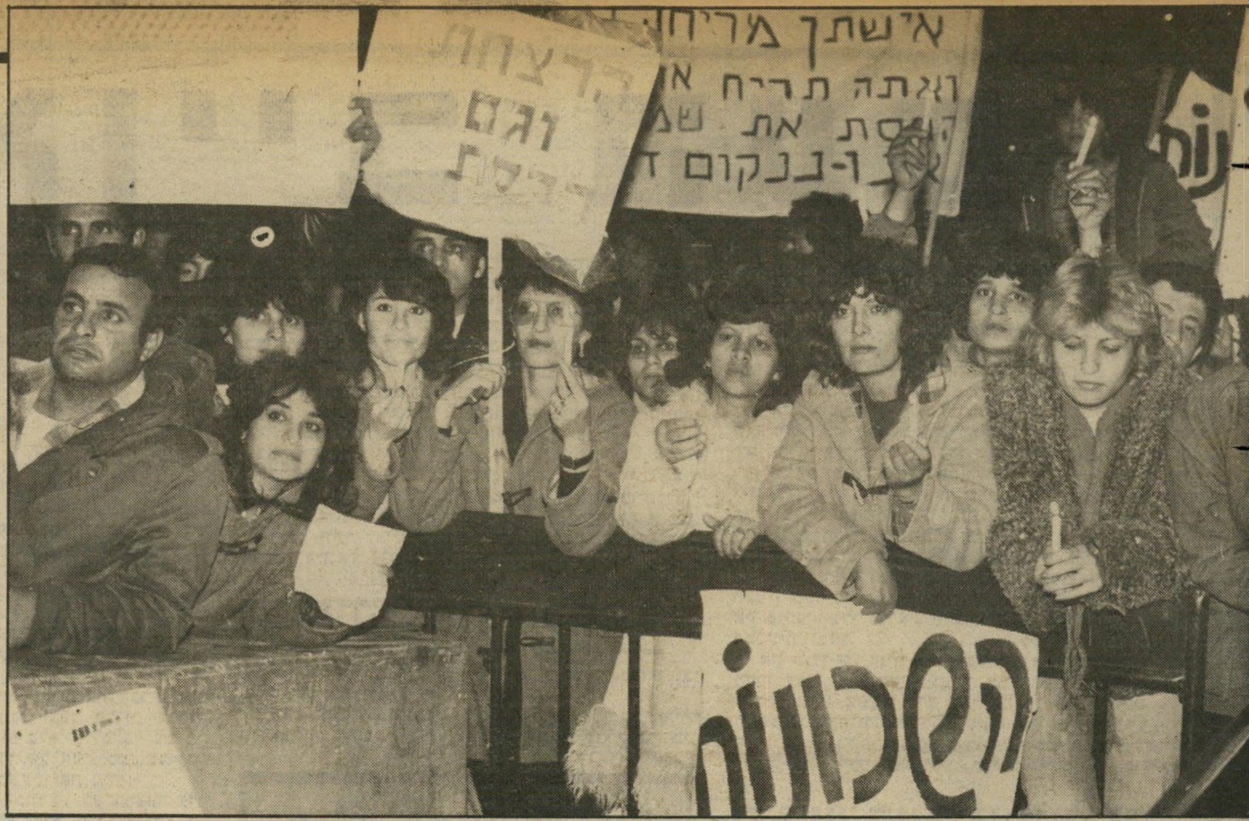
שעות, ושמועו נאומים שונים מפי חברי ועד השכונה ואמנים. מדי פעם פרצו בקריאות זעם נגד ראש-העיריה. בסוף ההפגנה התפזרו כולם בשקט, וכוח השוטרים הגדול שהוזעק לצורך שמירת הסדר נשאר בחוסר מעשה.

בני הכפר רוב האנשים הוועדו אל כיכר מלכיים ישראל באוטובוסים שנתרמו לצורך העניין עלידי חברת דן. הם הגיעו בעיקר מכפר-שלם, עמדו בקור עז במשך שלוש