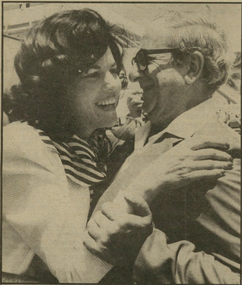
יצחק ואופירה נבון בשובה מסיפה אין פרטיות

עמה, הבת הבכורה של בני הזוג נבון, שיחקה בחצר והיתה די עצובה. מול צלם-הטלוויזיה, שצילם סרט-דיוקן של רעיית-הנשיא, היא הביעה את מורת רוחה מחייה בכלוב-הזכוכית ששמו מיסכך נשיא-ישראל, אמה, אופירה, נחמה או"ת: "עוד מעט נהיה אנשים רגילים". כאשר ראו צופי-הטלוויזיה הערבית את התוכנית פרופיל הגברת אופירה נבון ששודרה במוצאי השבת האחרונה, הם יכלו להבין הרבה יותר מה מתחלל בנפ"י של רעיית הנשיא. למרות שסרטה-טלוויזיה צולם לסירוגין במשך חודשים רבים, הוא לא שודר עתה במיקרה. בתוך זמן קצר אמור יצחק נבון להודיע אם הוא מתכוון לכהן כנשיא ב"תקופת-כהונה שניה, אם יודיע על פרישתו,