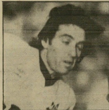
כדורגלן מכנס קורירוח

הרבה שחקנים פעלתנים, זריזים ומהירים אינם מצליחים להבקיע שער, בגלל פזיזות התרגשות. דווקא באותה שנייה