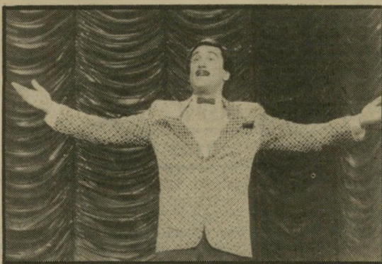
רוברט-דה-נירו: הופעה עוצרת נשימה

נים האחרונות. מנות גדושות של מין ש-התאפשר אחרי הפשרת כללי הצנוורה. המצלמה כחרב. הסינמה נובו היפשי של המוסיקה והמקצבים המיוחדים לארץ-משהו אחר. הוא אמנם עושה שימוש ביצ-רים העזים של המגז הלאטיני ובצבירות של המוסיקה והמקצבים המיוחדים לארץ-