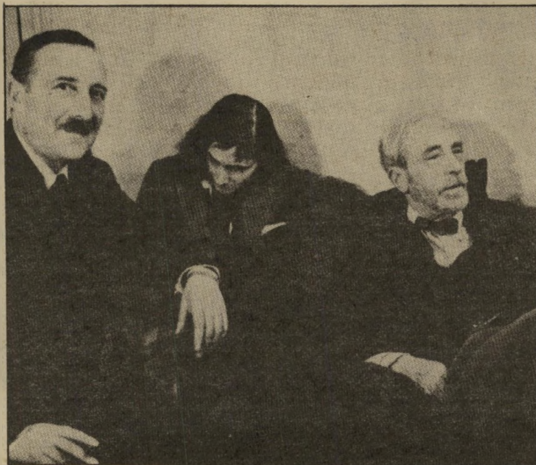
סופר צוויג ומשורר ואדרי נומשים את אירופה הפיתרון של תיאודור הרצל לבעייה היהודית

* סטיפאן צוויג — העולם של אתמול, זיכרונות של נויאירופה; עברית: צבי ארד; הוצאת זמורה ביתן — מו"לים; 317 עמודים (כריכה קשה).