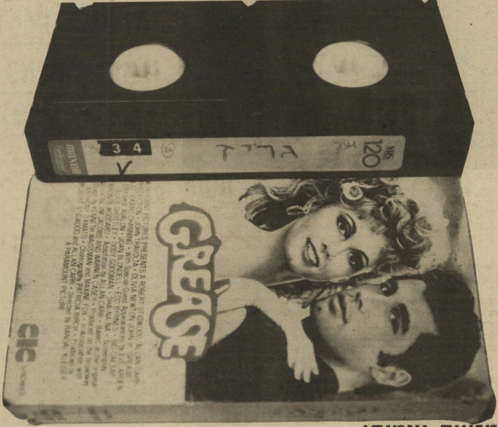
מזוייך ואמית' שתי קאסטות וידאו של הסרט האמריקאי "גרז". למטה מונחת הקאסטת האמיתית, שאותה אפשר לזהות בקלות. היא עטופה במעטפת הפירסומת המקורית של הסרט. מעליה הקאסטת המזוייפת שהיא