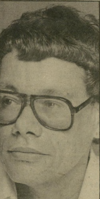
קורא מסים תגובה לתגובה

שאינם משוכנעים עדיין במה מני סים לשכנע אותם. למרבה שימחתנו (שימחתם של ישראלים השוהים בארצות-הברית והם חברים בתנועות-השלום הר מקומיות או יועצים להן) אין מס"ם מחערבת בענייניה של אג'נדה, ר כך ניתן לקוות שהאירגון היהודי החשוב והחדש (שרק אחד מנור שאי ההתענינות שלו הוא המיוחרי התיכין או ישראל ופלסטין) ימשיך בקו ההתקדמות העקיב שלו ל" עמדות מתקדמות וחדשניות בת" חומי העניין של הקהילה היהודית המתנוונות בארצות-הברית. מס"ם, ככל המיפלגות הציוניות המסויבות, נוח לה בחיקה של ועידת הנשיאים המתחדסת ומצדדי