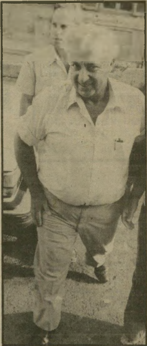
שר בחקירה שרף חיוכים בחוץ —

למי שעוד היה החשש כי ר-עדת-החקירה תוכל לטייח את מע-שה הזוועה בשכונות-הפליטים כי-ביירות יכול כעת להירגע: את השירות החשוב ביותר לצדק ער-שים החשודים עצמם, כשהם מס-תבכים בעדויות סותרות ומכנים