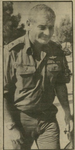
אלוף בחקירה דרווי — זוענות בפנים

הליכוד הסביע במיצחם של הישראלים אות-קלון ומוביל אותם לאברון. גם המערך אינו נבדל בהרבה ממנו. מהי האלטרנטיבה? לא ייתכן שציבור כה גדול, הי רואה בליכוד אסון למדינה, לא יימצא לעצמו ביטוי פרלמנטארי. אך כל ספק שציבור זה, בתמיכת חלק מהאזרחים הערבים בישראל,