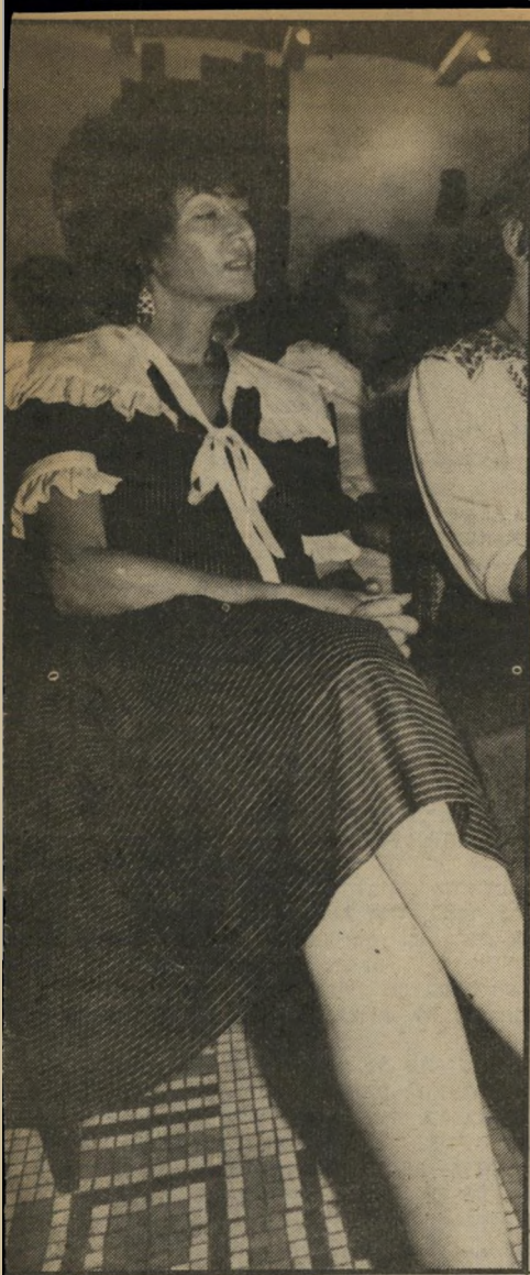
אופירה בישיבה משבר שני: אופירה ויתרה

שהחווה נלקח מביתו של כהן בגלל גלי-השמועות, אך הוא שמור במקום אחר, והוא יבוצע על-פי לוח-הזמנים שהשניים קבעו לעצמם. אחרי שהשניים כבר חתמו על ההסכם לגירושין, סביר להניח כי לא בנקל ישנו את דעתם.