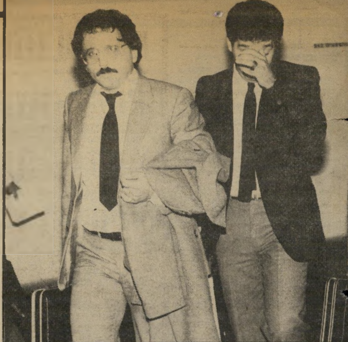
דייר סנגיפר (מפתיר פניו) ופרקליטו בן-עם רק ב'דוד ועוורת

עידת המשיכה את הסיוור בדירה ובחדרי-הילדים גילתה ערבי פצוע. שראשו חבוש בתחבושת, כשהוא ישן על אחת המיטות. "בסך-הכל היו חמישה אנשים בדירה", סיפרה עידית. מוזעזעת לגמרי רצה עידית ל-עורכי-הדין שפצירר וביקשה ממנו לעשות משהו. הוא הציע להגיש תביעת-פינוי, אך ביקש לערוך סיוור נוסף בדירה לפני הגשת התביעה. למחרת בבוקר חזרה עידית בלוויית עורכי-הדין ושני שוטרים ממיט-טרט רמת-השרון לדירה. הפעם היו כבר כמה סינויים. בבית לא היה איש אלא הערבי הפצוע שישן בע-רב הקודם על מיטות הילדים. הוא