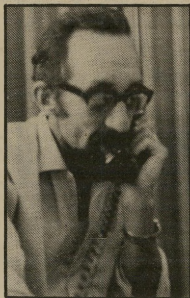
מפיק ספן מטרה הפוכה