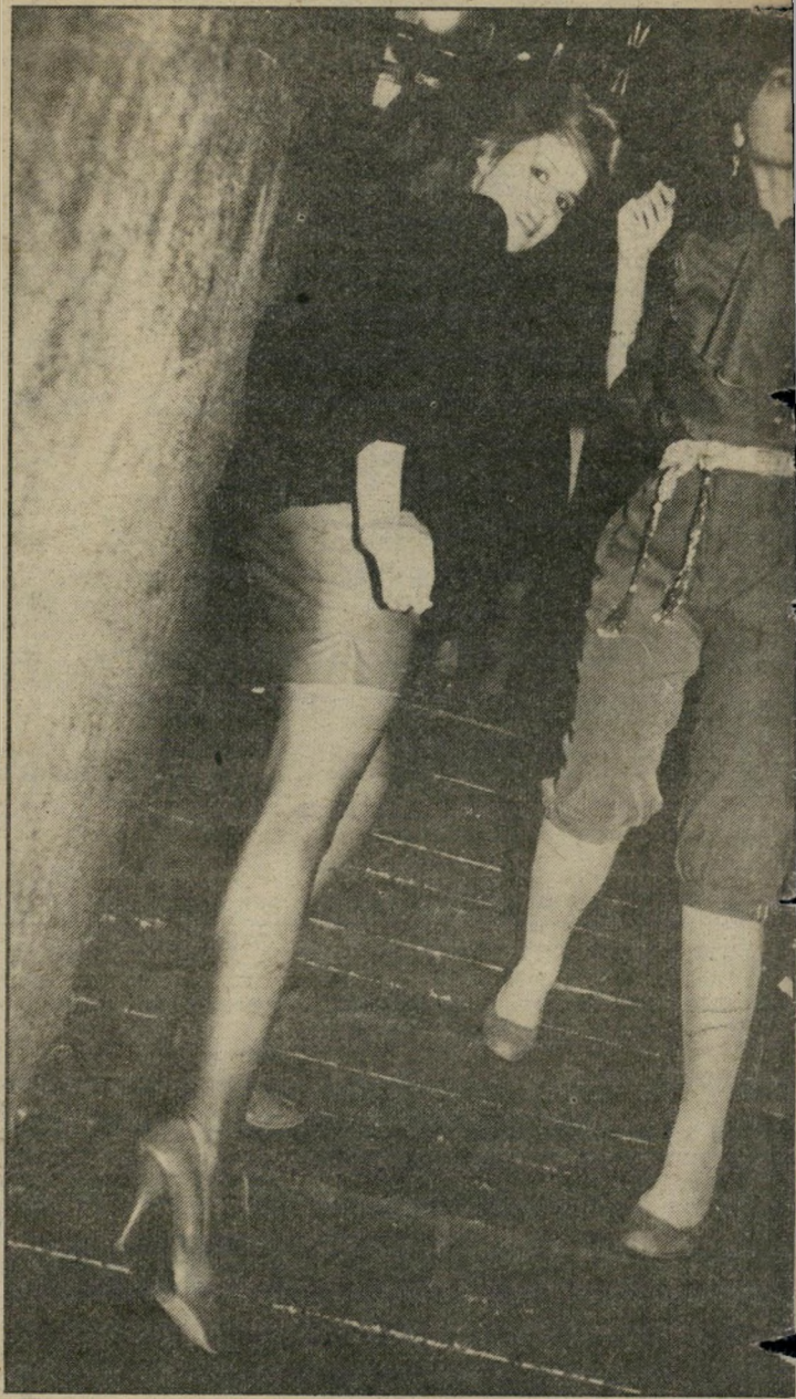
הבט אחורה בחיך בחצאית מיני מעור, נעלי עקב ודגליים משגעות, ממרת אלמור לקומה השנייה, אלימור היא נערת התקליטים במועדון החדש. היא משכה לרחבת הריקודים את החוגגים, שנענו לה ברצון.

שרים שזכו להתקבל למועדון החברים הסגור אפוקליפסה, ול' התהדר בתואר האכסקלוסיבי — "חבר". אתה רוצה לדעת מי ומי הם המיוחסים שכבר התקבלו למוסד ה' זה? ובכן: עורכי-דין, מנהל חברת-העופה, מזכירה, סוכני-ביטוח, סוכני-נסיעות, חוקר פרטי, אמן, מעצבי-אופנה, מפקי-קליטים, יה' לומן, סטודנט, רופא שניים, טכ-