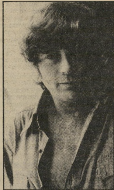
חרון חזק תלתל כטישרניחובסקי

בגלות בארץ עושה חזק תלתל כטישרני חובסקי בזמנו, תוך שהוא מפרסם איריליה תחת הכותרת פיתוי הכפר, שבו הוא מנסה ברלות חרוזיו ליצור אינטרפטציה כפרית אווילית שלו לקספא, לשמש, לעפרוני ול...מרתפי אירסה ברגנית. תוך שהוא מציג עולם ריקני, המתיימר להיות עולם ומלואו. נסיונו באיריליה זו לשרטט תמונת כפר, או קיבוץ, הן מבחן שחזק עומד בו