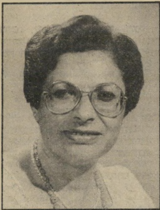
סגנית-שר גלזר-תעסה צייד-מכשפות

שרהחנינון-התרבות, גילתה, כי אלפי ישראלים, רובם צעירים בני 18-30, משתייכים לביתות מיסטיות הפועלות באחרונה בארץ... וכי עיקר פעילותן בערים הגדולות, ובמיוחד בגוש-דן... עוד מתברר כי חלק מהביתות הנחשבות רחוקות, הן בעלות אוסר מסחרי טהור ועוסקות בעשיית רוחים קלים ומחירים... גילויי הוועדה הבינמישרית של גלזר-תעסה נראים כבלתי שלמים, ורחוקים מהמציאות. ועדה בינמישרית זו מתעלמת מעוד כת מיסטית אחת, יהודית, שבה חברים בעל-כורחם כשלושה מיליון תכרים, כאשר מחציתם נשים משוללות כל זכות. גם כת זו עוסקת בעשיית רוחים קלים ומחירים ראה: ההסכם הקואליציוני, ובעיקר הסעיפים הרתיים תקציביים שלו. אין ספק, שמישהו השתגע במדינת-ישראל. ומי שהשתגע פתח בציד מכשפות. אבל ההיסטוריה הוכיחה שציד מכשפות הוא לרוב דרכיוני. מעניין מתי יבוא הבג"ץ לכיוון אותה כת מיסטית יהודית, שזועדת לגלזר-תעסה לא העניקה לה את הכבוד הראוי בחקירתה המעוררת גועל נפש.