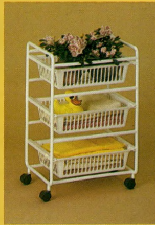
הסדרנית של "כתר פלסטיק" תספק לך מרחב איכסון רב למגבות ושאר פריטי האמבטיה. לבחירתך ב 3 וב 4 קומות ובשלל צבעים.