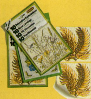
מדבקות לחרסיה, מדבקות מעצמן (Self adhesive) מתוצרת "רברמיד" במגוון חגמאות וצבעים. מקשטות את הקיר ונרחצות בקלות ולאורך זמן.