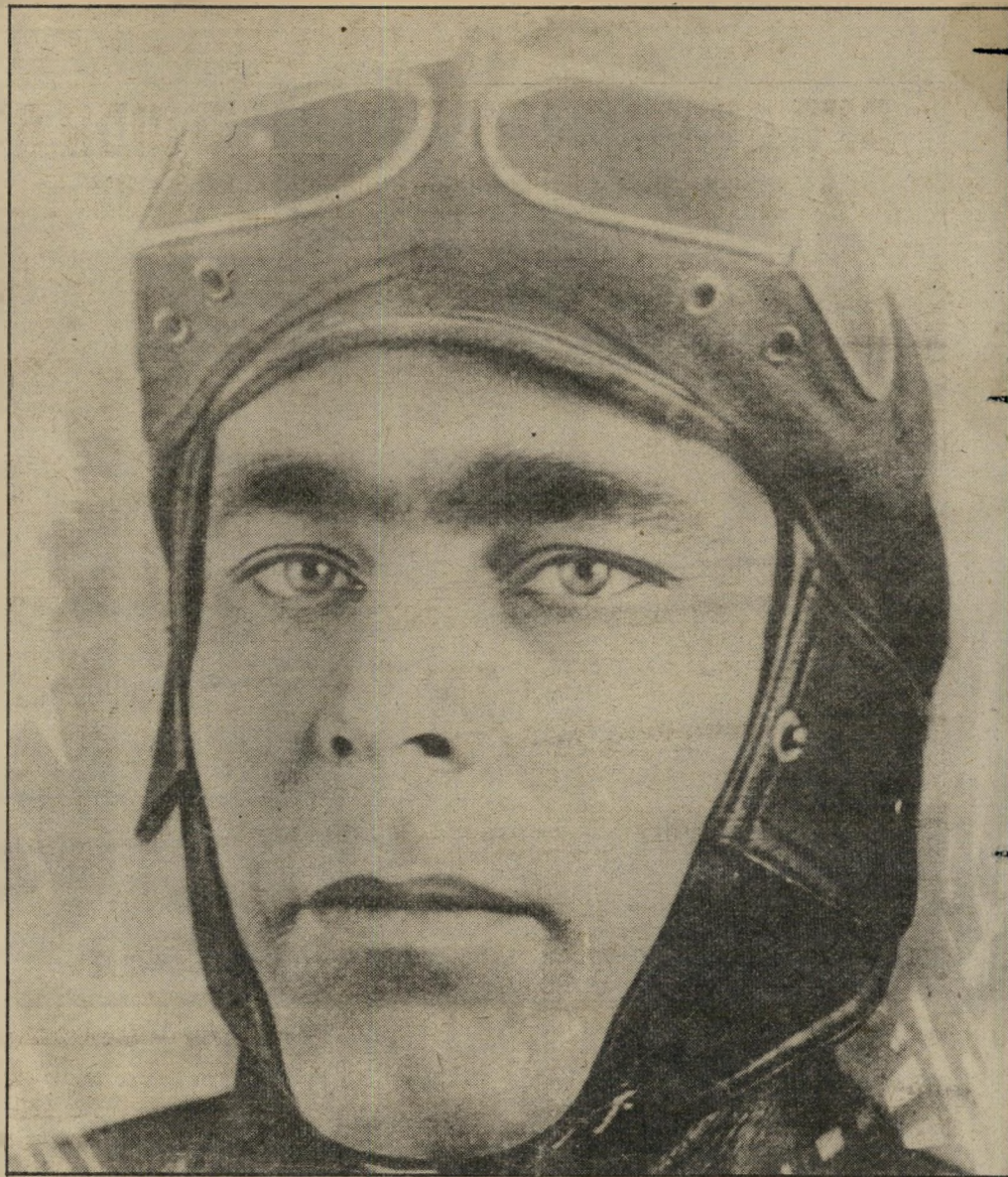
1936 – ליאונרד ברוננייב בתפקיד קומיסר פוליטי בתמונה למעלה וב-1981 – בתמונה למטה