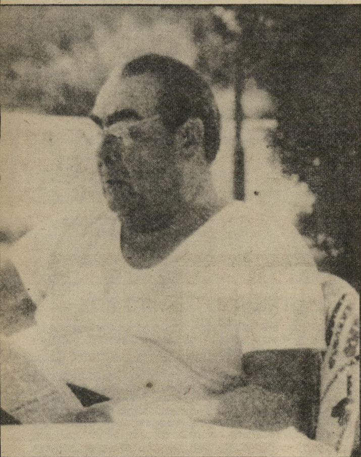
1973 – עם ריצ'ארד ניקסון בבית הכבן בתמונה למעלה ובדאצ'ה שלו בתמונה למטה