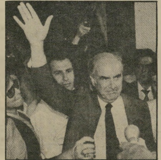
אנדריאה ספנדריאו אנדורפוב נוטה חסד

לא ברצינות. פרשנים אירופיים נוטים לייחס את התאפקותם של הקומניסטים היווניים גם למניעים יתר גלובאליים. אין ספק שמוסקבה מעוניינת בהמשך כהונתו של ספנדריאו, בעיקר בשל מדיניותו האנטי-תורכית. פרשנים ואנשי-מודיעין סובייטיים לא התייחסו אף פעם ברצינות להבטחות הבחירות של מיפלגת השלטון פאטוק. לא האמינו שתהיה פגיעה משמית בנאט"ו או בארצות הברית. לכן גם אינם מאוכזבים במיוחד מהמדיניות