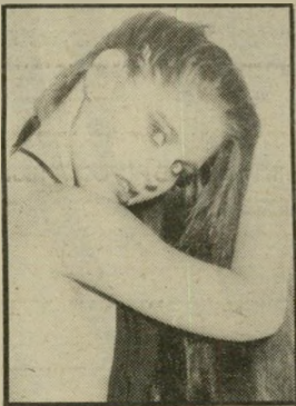
דוגמנית צחור לבקשת החייל

אני חייל בודד, עולה-חדש מארצות-הברית, הנמצא באיזור ביירות, למרות שרציתי לגור בישראל ולא בלבנון. יש לי בקשה: בגליון 2360 של העולם הזה ראיתי את ת-