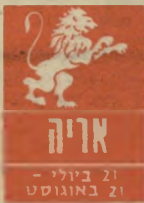
אריה 21 ביולי - 21 באוגוסט