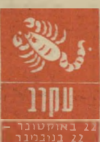
עקרב 22 באוקטובר - 22 בנובמבר