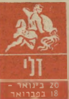
זלי 20 בינואר - 18 בפברואר