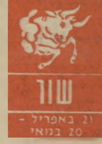
שור 21 באפריל - 20 במאי