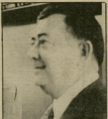
יו"ר גולן — בלי מס