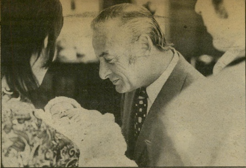
מושבין בכרית-מיהה תרגיל בחשבון