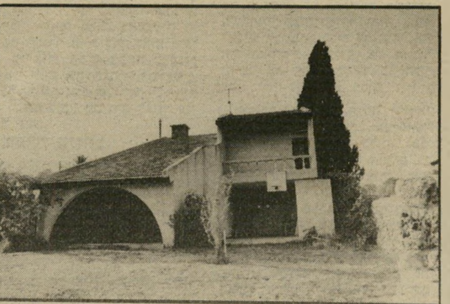
בית המריבה בנהלל. אני רציתי בית יפה ונחמד.

שכחתי לספר לך דבר הכי חשוב: אני יצאתי מהבית בנהלל רק עם הבגדים שלי, ושלוש עבודות-ידי