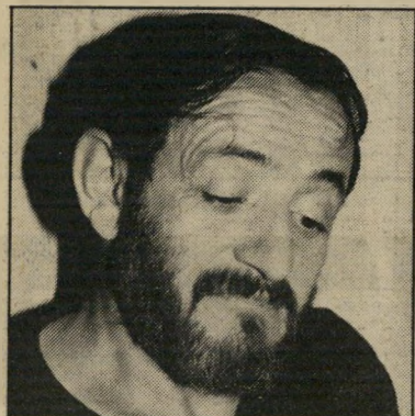
מחזאי כפר טיבסוד מיותר

● תחת הכותרת הרמטכ"ל בא להודות למרים ילן שטקליס ראיור בדיעות אחרונות אחד מסיפורי האבסורדים של ישראל, חסרת הרוח ושארירות. סוף 1982. המשורת הקשישה שואלת את הרמטכ"ל, שהגיע אליה משיבת ועדת-החוקי-הביטחון: "נו, ואמרת להם את מה שצריך לומר?" והרמטכ"ל מסביר למשורת, שפעוטות גן הילדים מאוהבים בשיריה, את מטרות מלחמת הלבנון: "כדי שלא יהיו יותר קפיוזות על קריות-שמונה וכדי שלא תהיה שם פלינה פלשת'נאית". המשורת שואלת את הרמטכ"ל מה בכונתו לעשות אחרי שיפשוט את מדיו, והוא משיב לה: "לאהבת חיי הישנה — הנגרות". הרמטכ"ל אינו מפרט באוזני משורת-הילדים הקשישה אם בכונתו לעשות פינגוויים שילחמו במלחמות-העתיד, או שרפרפולים שיימכרו למימון המלחמות-הבאות. אבל המשורת הסגלית מתריעה ואומרת לרמטכ"ל: "אתה האדם החשוב ביותר במדינה. אסור לך להיות נגד..." בארצות-הברית, כאשר הגיעה מלחמת-ויאטנאם