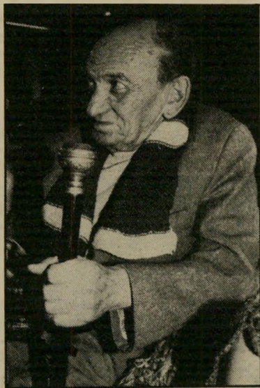
משורר רטוש צעיר עברי על פרצופים יהודים

מע — הוא נאמן למולדת שלו." כאן מת-כוון רטוש ליצור את הקרע שבין דור הבנים ובין העבר הקיבוצי של הוריהם (קרי: הגלות). המאמר עינינו נשואות אל השילטון הוא מאמר מוקדם של רטוש.