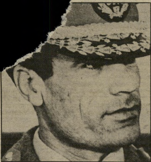
מועמר קדאפי טובה מפתיחה במתינותה

שלושה יומנים בריטיים דיווחו באמצע נובמבר על הקולונל מועמר קדאפי. לפי ישראל, נעצרו בסוף אוקטובר את קדאפי ולטול לידיהם את ה כיום מודים הכל, כולל שלושת