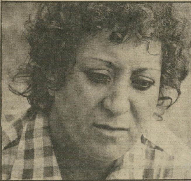
מגות-עיתודת בדרה ארוחת הערב הפכה —

הרקע לרציחותיהם של הניורים בכנסית באר-יעקב בשכם היה שיגעונו המיוחד של רבו, השיגעון למים זכים. בלימודיו בתורת-הנסתר הגיע למסקנה כי האדם נולד בריא וחסון, וכי הגורם העיי-קרי למחלות הרבות הם המים המזוהמים המגיעים לברזים. מזה שנים אחדות שהוא עצמו אינו שותה מי-ברז, אלא אוסף מי-גשמים ושותה אך ורק מהם.