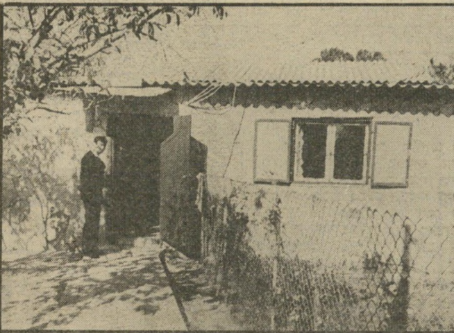
בית בדרה בלוד — ארוחת דמים

שלושה ימים אחרי הרצח. כאשר ביררו בלוח-השנה גילו כי הרצח אומנם בוצע בערב חג-הספסח, ב"שעה שבה נהוג לבער את החמץ. רבו עצמו אינו מרגיש אשם על מעשיו, כאשר נשאל שוב ושוב מדוע עשה זאת, הניד בראשו ואמר לחוקרים כי הם אינם מבינים אותו: "זו לא היתה החלטה שלי", אמר להם. "זו היתה החלטה המל-אכים והקדוש-ברוך-הוא. הם ציוו עלי לעשות זאת".