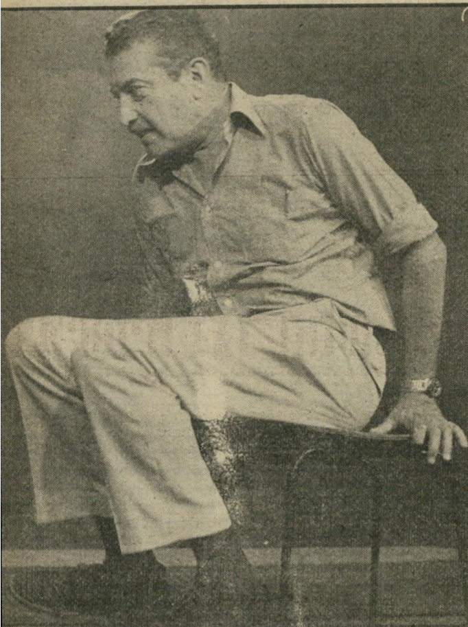
לקום מהכיסא או להישאר יושב?