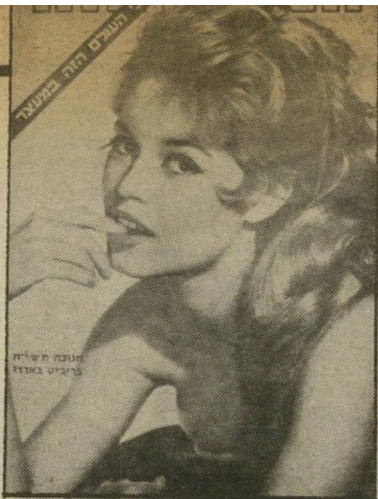
העולם הזה 1055 תאריך: 18.12.1957

בסדרה שעסקה בגילויי עיסקי הספורט הובאה תחת הכותרת "סוחרים בזיעת הכדורגלנים". בשער הגליון: כוכבת קולנוע ברזיט ברדו.