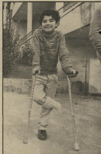
הצוחק ילד קטן שנותר נכה מהמלחמה האחרונה. לדיברי המטפלים בו הוא אינו פוסק לצחוק.