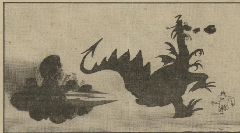
דרקון בפעודה ב„חוליה חסרה“ — כדי למצוא בטיס לסאטירה

כמה שעות אחרי הקרנת-הבכורה של חוליה החסרה, וכאשר נודע לו שהמושחת עימו היא עורכת מדור-קולנוע בעיתון ישראלי, הוא הגיב מייד „אני יודע שב-ישראל הפיצו רע מאוד את הסרט הראשון שלי, טרוון. הכניסו אותו לביית-קולנוע הציג קודם לכן סרטים פורנוגרפיים, הרגידו אותו אחרי שבוע, והוא הוא צדק. הסרט עבר כהרף עין בקולנוע 17 המנות,