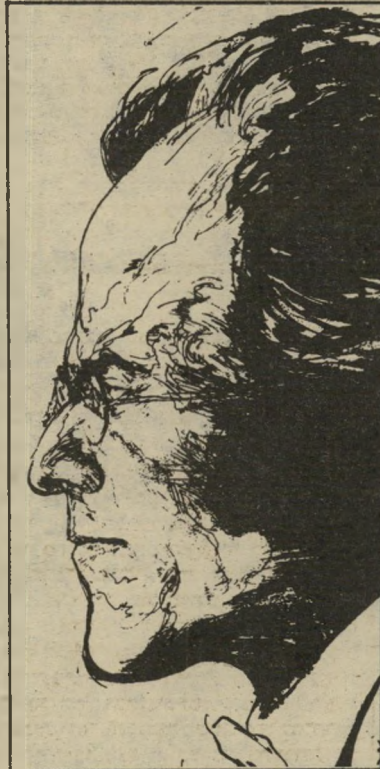
מלחין מאהלר הכלאת מוסיקאי עם רץ מרתון

גדולי אותו תור הזהב גונו עליידי החברה הגרמנית על שום יהדותם, כמו איינשטיין שלכאורה עסק במופשט שנמדעים, והותקף על שהכניס פיסיקה יהודית למדע הגרמני. יונג האשים את פרויד שהוא ספק של פסיכולוגיה יהודית וגם מאהלר שמע מבקר אומר על המוסיקה שלו, שהיא מדברת במיבטא יהודי. לא פלא הוא שהיהודים מאכלסים את רשימות היוצרים האסורים. בתרבות הגרמנית, בנייהם: קארל שטרנהיים (הסנוב), ארתור שנייצלר (המעגל), ארנסט טולר (הורסי המכוננות), ואלטר האזנקלורר (הבן), פרידננד ברוקנר (מושעים), ברוך (מות וירגילוס), פרנץ קפקא (המישט), אלפרד דאבלין (ברלן אלכסנדרפלץ), יעקב ופרמן (אשליית העולם), ליון פויכטוונגר (היהודי זיס), פרנץ וורפל (ארבעים הימים של מוסא דאג), ברונו סראנק (ימי המלך), ארנולד צווייג (מישפטו של סרגנט גרישה) וזוף רוט