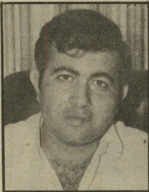
קורא יהב מזירעב

למיטב ידיעתי אין אמת בטענה כי דויד לוי יום בעבר הקרוב פגיי שם עם יורם ארידור. ממילא לא נכונה הידיעה כי לוי היתנה קיום