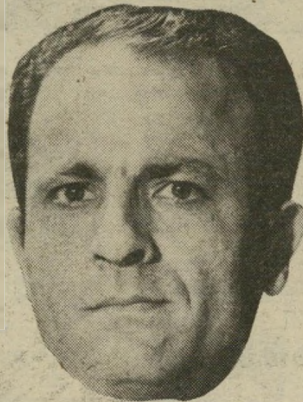
ראש-מועצה עמר נקי כפיים

איש אחד, ששמו היה ידוע רק לשכניו ולקרובי מישפחתו, החליט להפוך פוליטיקאי. מה עושים? מצטרפים לרשימתו של בגין - הוא מושך קולות נהדר, ומצליח ליה להכניס אחריו לכנסת שובל ארוך של אלמונים. אך אויה: הי