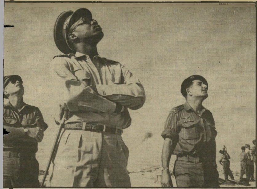
מובוטו ורכין (משמאל) בישראל מהו המחיר?

שמישהו שילם לחשבון פרטי 10 מיליוני דולר עבור ההכרה בישראל. השאלה היא: האם כדאי לישראל לה- זור בזאיר על פרשת התערבותה באיראן, ולקשור את שמה במישטר רקוב, מושי- חת ורודני? כל הכוחות המתקדמים ב- רחבי היבשת מתעבים את מובוטו, ויחגגו, בבוא העת, ביום נפילתו, כשם שחגגו ביום נפילת אידי אמין, כמו מובוטו, עבר השתלמות צבאית בישראל.