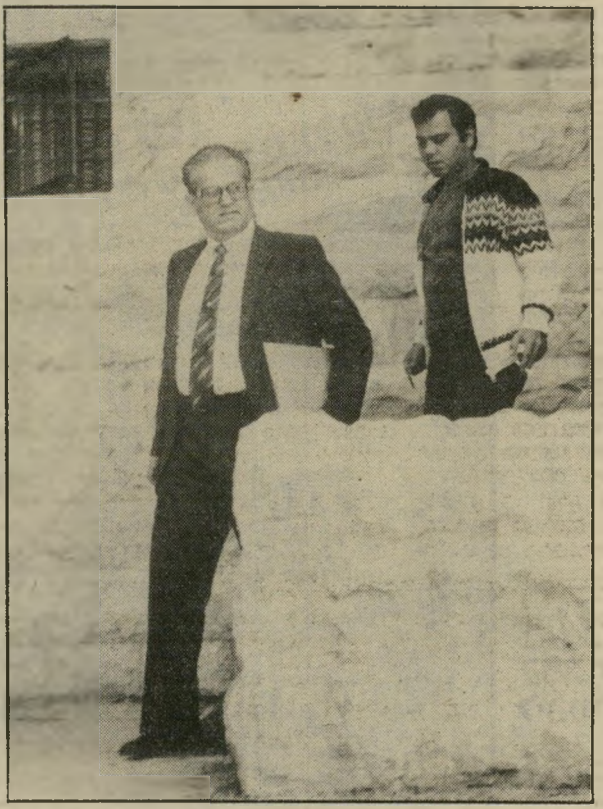
ציפורי יוצא אחרי עדותו, יש שחיטה!

ד יפזומט הוא, כידוע, אדם המי שקר למען המולדת. משקר — כלפי חוץ, אך תמיד יש חשש שמא אדם המתמחה בשקר כלפי חוץ מתרגל ל"אמירת אי-אמת, ומתחיל לשקר גם כלפי פנים.