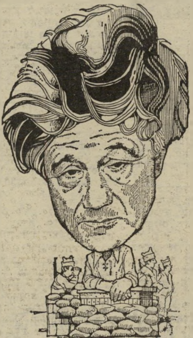
מחנך-לספרות יזהר ההר ילד עכבר ציטוטים

למחבר, ולמשכתבו (וגם למבקרו), שבה הוא מציע לקרוא הישראלי (באופן תתי הכרתי): תקראו את ימי ציקלג כסיפור של יחידת חיילים הניצבת מול האויב, ומייצגת את דור מלחמת-השיחרור — ותבינו את הסיפור כמות שהוא. אלא שהאמת של ימי ציקלג היא שונה