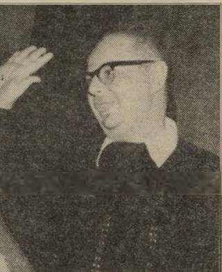
קורא שחק עיניים בראש

לעומת זאת, אין זה נכון כלל, שהאירגון ניר גואיש אגידה ב"ארצות-הברית, דוגל בעמדות זהות לאלה של שלי" והמועצה לשלום ישראל פלסטין". אירגון זה בפ"ר רוש אינו דוגל במדינה פלסטינית בשטחים, ואפילו לא בזכות ההג"ר דרה העצמית של העם הפלסטיני. גם בעניינים חשובים אחרים אין לאירגון זה עמדות עקרוניות, ו"כנגד חברים בודדים בעלי עמדות "טובות" יש חברים בודדים אחרים שהיו בהחלט יכולים להיות חברים של זבולון המר, למשל. הם מצטטים - לטובה - את הרב ש"ך, כפי שאני יכול להעיד מנסיוני.