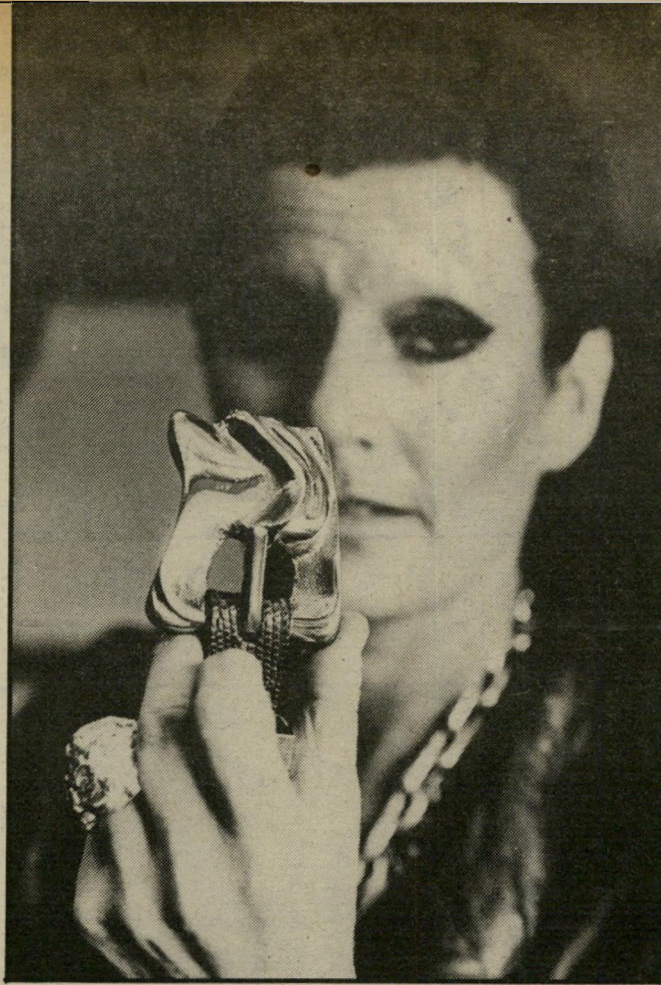
פסלת גור ואבום פסלים ותכשיטים

עד כאן דבריה של איילנה גור. הכרה בינלאומית. הפסלת המבלה ב-25 השנים האחרונות בין