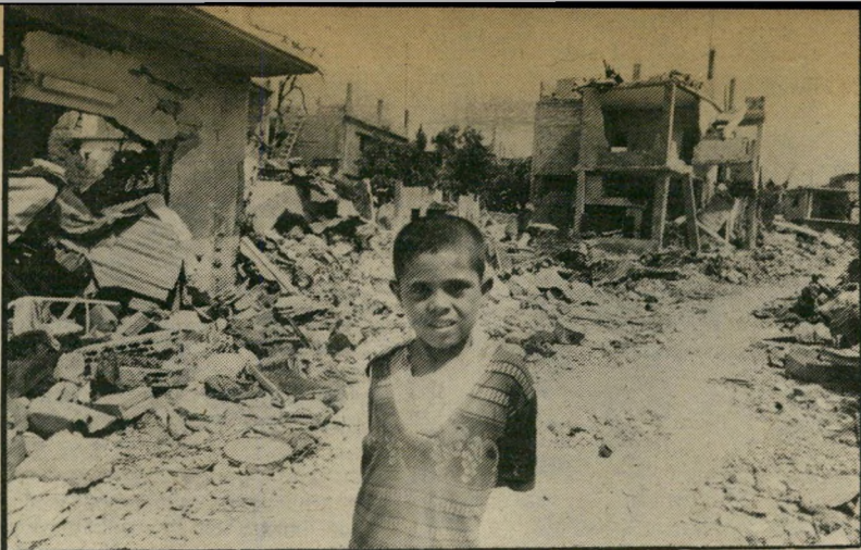
להרוס - מייד אחרי כניסת צה"ל למחנות הפליטים הפלסטינים ברשידייה ובטין אל-חילוה, פעלו הבודדורים במחנות, והרסו את הבתים, כאשר עשויות אלפי פלסטינים נותרים ללא קורת-גג, לקראת החורף הלבנוני הקשה.

ברנטל אינו יכול להתייחס לפרטים הטרומיים הנוגעים לבתים שמנסים למכור לפליטים. בעניין זה הוא הפנה את העולם הזה בחזרה אל ישראל אליאס, או אל זוהר