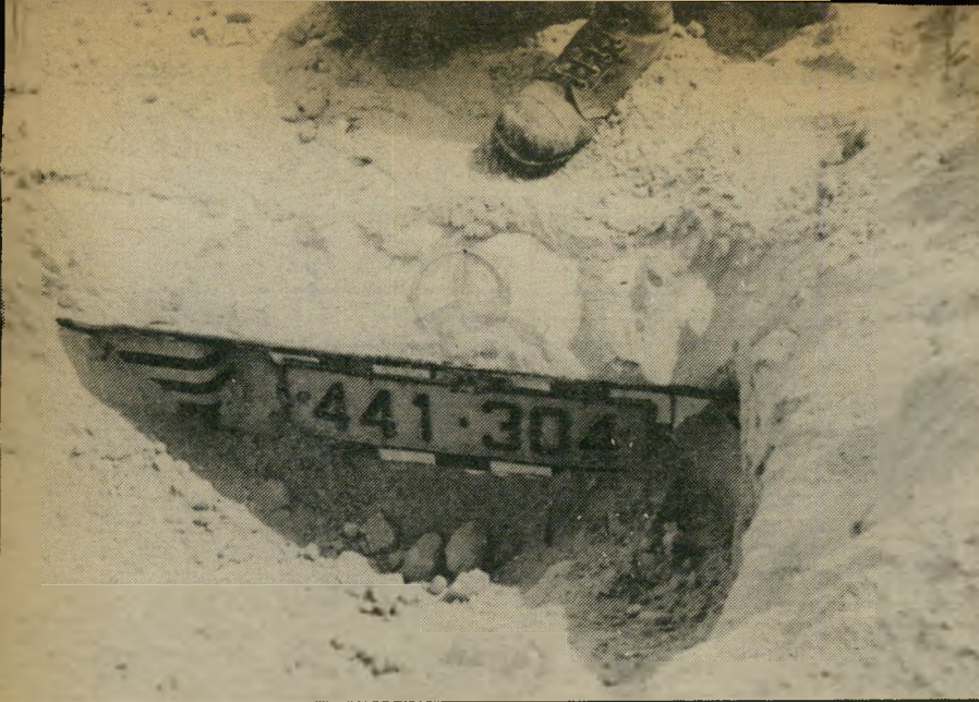
..מרצדס" קבורה החלק הקידמי של מכונית שנמצאה בחולות סיני ערב הפינוי. היה זה גדול מיבצעי חברת הסורקים, על פי עדות מנהלה העובדים ועזרו באמצעי איתור משוכללים וכזה.