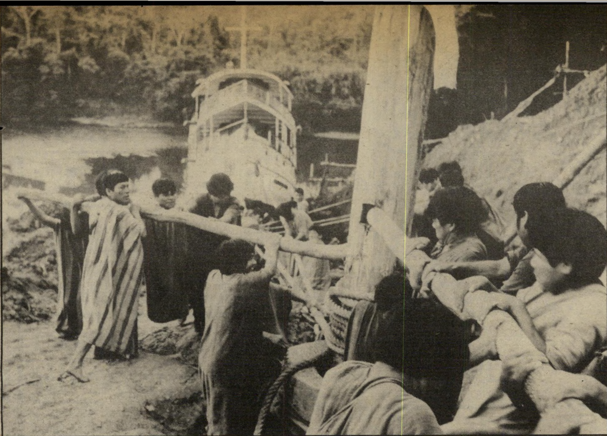
הניצבים האינדיאנים מעלים את הספינה על לשון האדמה במעדה האמונס סיפור כפול של אובססיה

האובססיה השניה היא של הרצוג עצמו. שהתעקש לעשות את הסרט הזה בכל מחיר, למרות מטע של מיכשולים משי-ברים, בעיות ותקרים, אשר היו שוכרים כל אדם אחר, אך לא אותו. ההסרטה נמשכה ארבע שנים ויותר, את התסריט היה צורך לכתוב מחדש תוך כדי הסרטה, אחרי שהכוכב הראשי האחד (ג'ייסון רור בארדס) פרש בשל מחלה ולא חזר, וכוכב שני (מיק ג'אגר) פרש משום שה צילומים התעכבו יתר על המידה והתר נגשו עם התחייבויותיו הקודמות. את אתר ההסרטה החליפו פעמיים, לא מתוך רצון אלא מכוח המציאות, אחרי שה צוות מצא את עצמו בין מחנות ניצים של מורדים ומישטר, ונוכחותו במקום