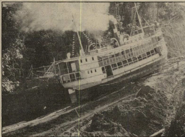
הספינה של פיצג'ראלדו עומדת על היבשה הרוח האנושית מנצחת

הבלתי אפשרי. פיצג'ראלדו עם כנר פיית המלחים המפוקפקים שלו, עם האיני דיאנים המשתפים עימו פעולה, כי הם משוכנעים כי הוא אל מן החלל החיצון.