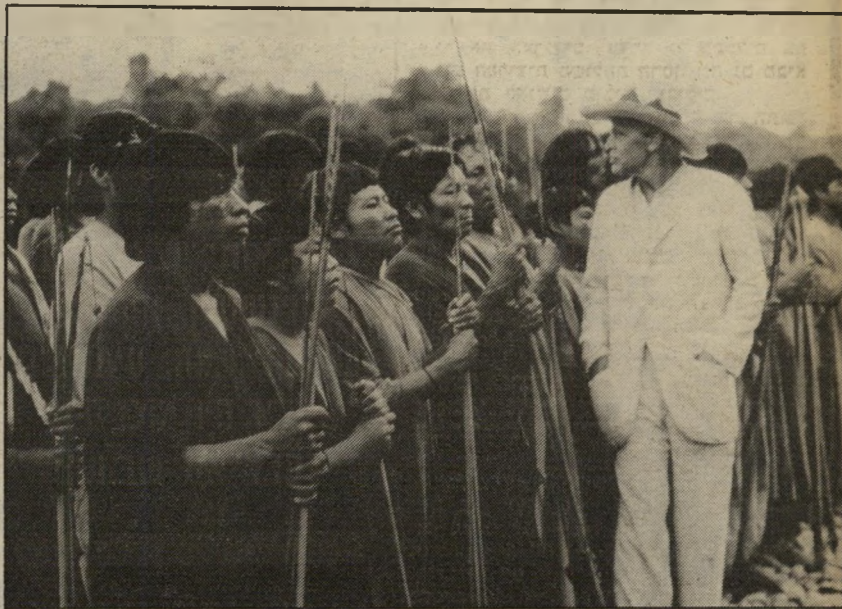
קדאום קינסקי בתפקיד פיצג'ראלדו לעשות את הבלתי אפשרי

זאת מתוך שימת דגש חזק על הצד הפי יוטי של העלילה.