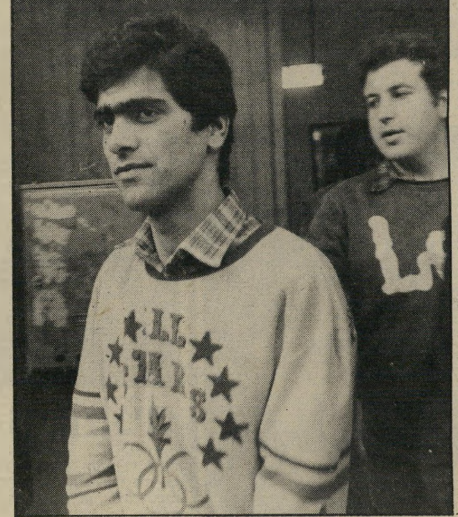
נאשם בן-דוד קשיים בתיפקוד מיני