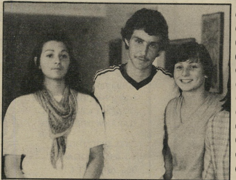
הייקה, שתי ומרטינה לגרמניה וחזרה