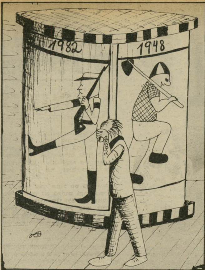
ללא מיקים בין השורות

עם כל ההבנה לאבול הפירטי — היה סיבה מספקת לחזור בלבן ארי האם האסון שקרה בלבנון. שבו קיפחו את חייהם 75 חיילים, לא צה ולנחם את מישפחות הנפלים? מרים מורנגשטרן, תל-אביב