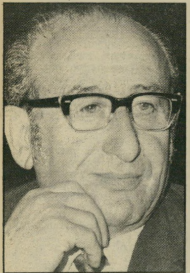
קבני רובינשטיין, הזוג של גיל הזוג

גו, אז מה כבר כל-כך מעניין? לאח-רונה פורסמה ברבים עיסקה בלתי רגילה