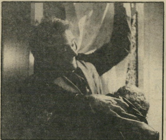
קלינט איסטווד: מילחמת הכוכבים

שועל האש (אסתר, תל-אביב, ארצות-הברית) — זהו החלש שבין כל סרטי קלינט איסטווד, שבו הניצול המחוט מוצלח בכישוריו המיוחדים של השחקן. אולי הכישלון המיסחרי היחסי של „ברונקו בילי" הוא שדחף את איסטווד לעסוק בספור הזה, על טייס אמריקאי שנשלח לברית-המועצות כדי לגנוב משם את המטוס החדש ביותר בעולם. אם כך, יש להניח שההימור הצדיק את עצמו, כי עד היום חכניס הסרט לא מעט כסף, וכנראה ימשיך בכך, אולם אותה התכונה המיוחדת שהיתה פעם בסרטי איסטווד, כאלה שהוא ביים וכאלה שאחרים ביימו עבורו, חסרה כאן לחלוטין.