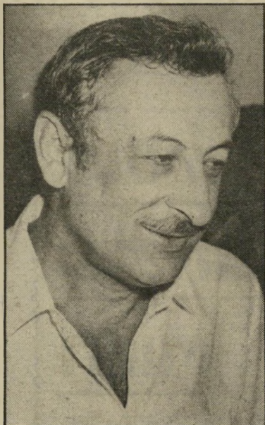
סניגור מקריין ח' 43

אותה דוגמה, קשה היה כי שלב זה לתאר תיק סגור יותר מ-