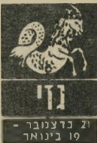
21 בדצמבר - 19 בינואר

בזמן האחרון אתם מרגישים יותר אופטימיים, התלהבות ויכולת ליהנות מהחיים. הגישה הכללית חיובית וזה יכול לעזור לכם להתחיל בעסקאות חדשים. כדאי להתחיל ביימודים העשויים לקדם אתכם. אלה מבינים כש מתמסרים לאמונתם, יוכלו להקדיש חלק ניכר מזמנם ליצירה, וההתקדמות תהיה טובה ומספקת. ידידים חדים שים מהדקים את הקשרים והיחסים הפוכים להיות יותר רומנטיים ומלאיבים.