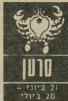
21 ביוני - 20 ביולי