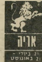
21 ביוני - 21 באוגוסט