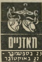
23 בספטמבר - 22 באוקטובר